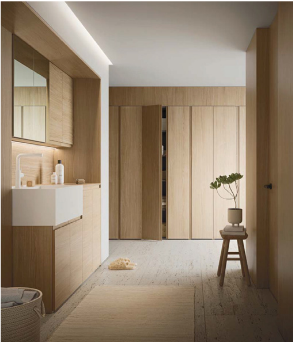
Bolle is a modular, flexible programme for the organisation of utility spaces in the home.